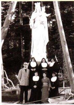
●聖母像建立工事を終えて