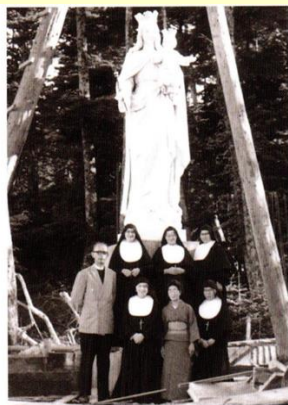
●聖母像建立工事を終えて